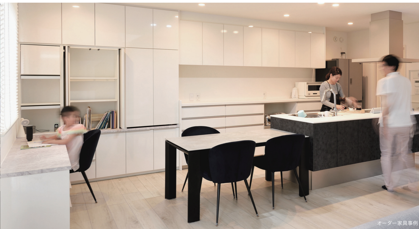
オーダー家具事例

エストレージのオーダー家具には「地震から命を守る」というもうひとつのコンセプトがあります。1995年に発生した阪神・淡路大震災の死因第一位は「圧死」。建物の7割が倒壊を免れたにもかかわらず、転倒した家具や家電によって命を奪われてしまったのです。しかし、世の多くの家具は耐震性の検証がされず、壁や天井に固定もされていません。オーダー家具は贅沢品ではなく「家族を守る家具」です。私たちはすべての家具において耐震性を検証し、自宅へ伺い安全に設置します。それが、家具を手がける者としての責任だと考えています。