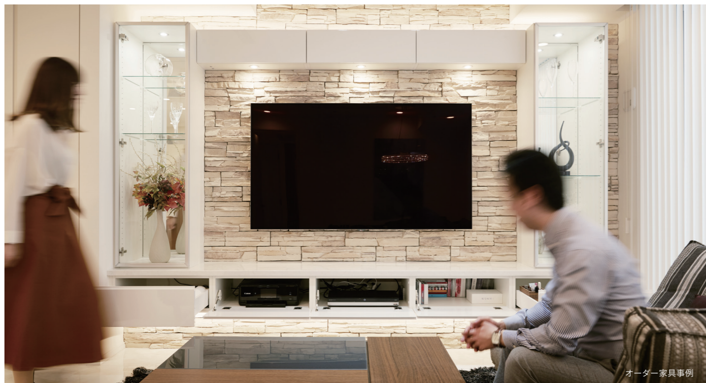
オーダー家具事例