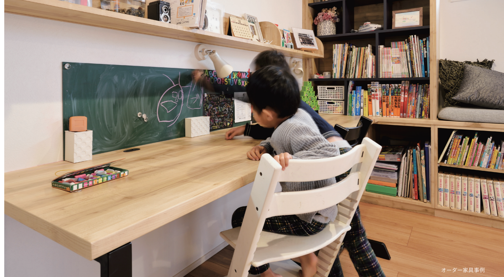
オーダー家具事例