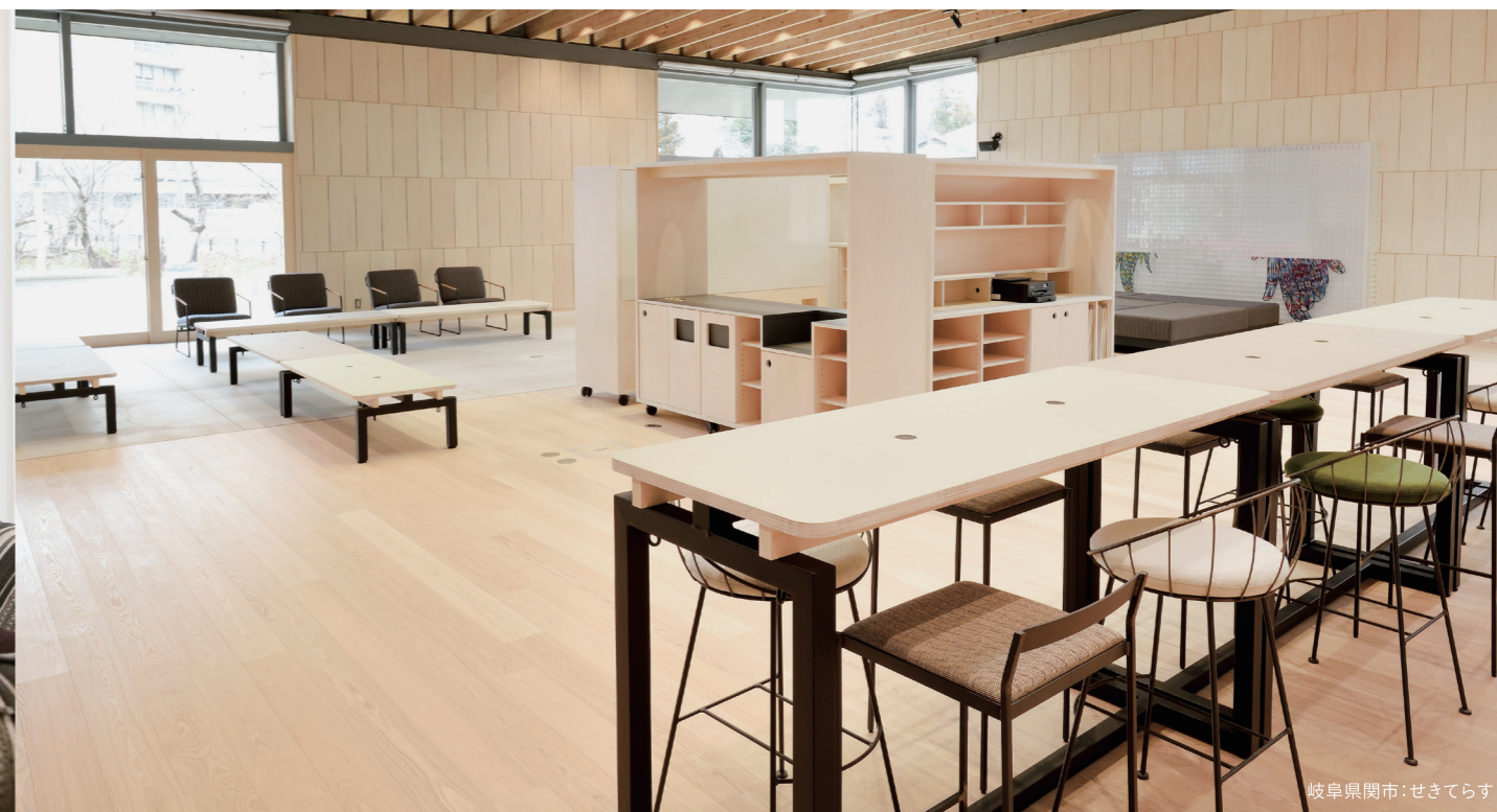
岐阜県関市:せきてらす